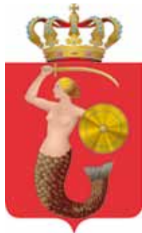
Wappen von Warschau