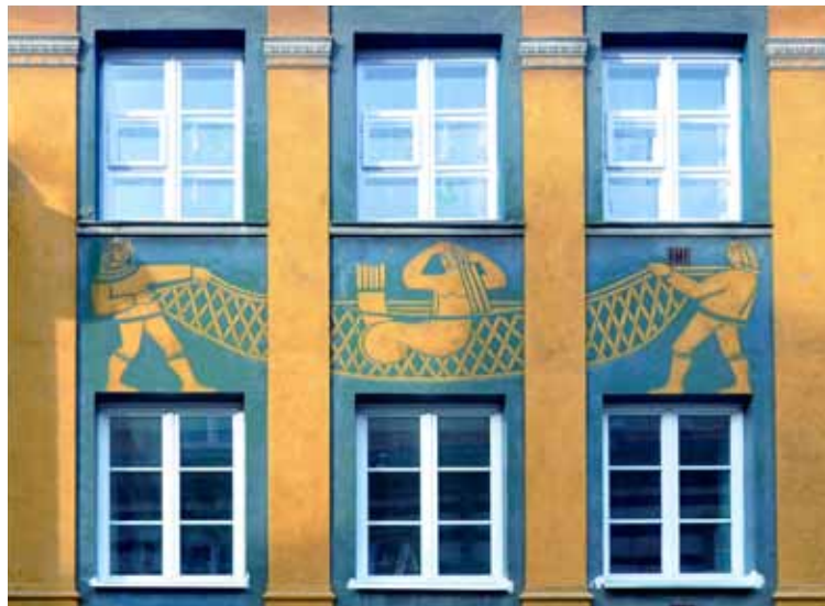
Mietshaus an der Ulica Kościelna 8/8A

Ein Kaufmann, der von der Meerjungfrau erfuhr, rechnete sich schnell aus, wie viel er verdienen könnte, indem er sie auf Jahrmärkten vorzeigte. Er nahm sie durch eine List gefangen und schloss sie in einer Hütte ohne Wasser ein. Das Weinen der Meerjungfrau hörte ein Fischerssohn, der sie daraufhin mit Hilfe seiner Freunde befreite. Aus Dankbarkeit versprach die Meerjungfrau ihren Rettern, dass auch sie sie beschützen werde, sollten sie Hilfe brauchen. Und seitdem verteidigt die Meerjungfrau, mit Schwert und Schild bewaffnet, die Stadt und ihre Einwohner.